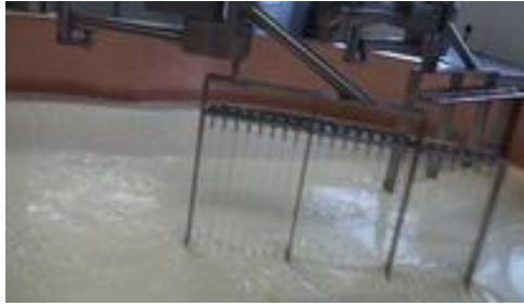
Illustration 1 : Le tranche-caillé découpant le caillé

Après avoir ciblé et caractérisé le geste professionnel dont l'enseignement va être étudié, il s'agit de repérer les situations d'enseignement pertinentes à observer pour en étudier la fonction de transmission et en comprendre le contexte et les conditions.