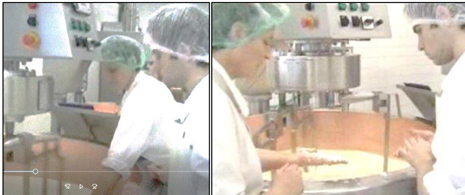
Illustration 2 et 3 : Médiations du formateur pour l'enseignement du geste de décaillage lors du démarrage et de la fin de cette action (photos tirées de la vidéo)

Ainsi, concernant la transmission du geste de décaillage, la comparaison des médiations déployées par le même formateur lors de deux séances de formation à neuf mois d'écart avec le même apprenant pour le même type de fabrication permet de montrer que le formateur confie la réalisation de ce geste critique aux apprenants dès les premiers moments : le stress de l'objectif économique apparaît alors comme une condition de réalisation du geste à acquérir. Il leur laisse progressivement davantage d'autonomie dans sa réalisation entre les séances 1 et 2, ceci bien qu'il continue de prendre en charge (en partie) le lancement et la fin du décaillage (Illustration 2 et 3 :). Durant cette étape, ses interventions sont moins nombreuses lors de la deuxième séance (on passe de 6 à 3 interventions) et elles changent de forme : ordres avant l'action lors de la séance 1 (« augmente la vitesse ») ; puis plutôt questions, suggestions sur la réalisation du geste ou évaluation lors de la séance 2 (« tu peux peut-être changer un outil là, non ? » ; « qu'est-ce que tu en penses [de la fermeté du gel] ? » ; « c'est pas mal hein [la taille des grains de caillé] ? »). Enfin, les composantes du geste en jeu dans ces micro-situations concernent, pour l'essentiel, l'exécution de l'action (OP) (part qui se réduit entre les 2 séances) et les prises d'informations (PI) (Illustration 2 et 3 : Erreur ! Source du renvoi introuvable. ), mais très peu les composantes conceptuelles du décaillage (C ; INF).