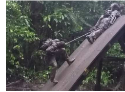
Hervé de Bisschop - MCC