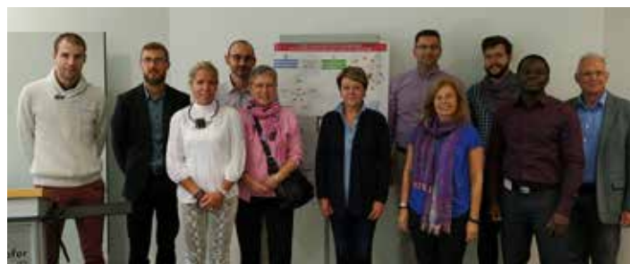
Figure 2 : Les partenaires du projet FITNESS lors de la session test au Fraunhofer Institute for Process Engineering and Packaging (Freising, Allemagne)

ou leurs spécificités. La mise en commun des expériences des enseignants-chercheurs et l'expertise des centres techniques à l'échelle européenne sont propices à la création de contenus originaux adaptés aux besoins actuels de l'industrie. Le contenu est en cours de consolidation. La visite régulière de la page principale des cours ( https://fitness.agroparistech.fr/fitness/lectures/html/ ) est encouragée pour suivre l'évolution du contenu (38 cours disponibles à ce jour). Des ouvrages généraux ou spécialisés seront également mis à disposition libre de droits (exemple : https://fitness.agroparistech.fr/fitness/references/ ). Les guides pratiques sont en cours de rédaction et seront bientôt mis en ligne. Les outils de calcul portés par la plateforme SFPP3 de l'INRA ( http://sfpp3.agroparistech.fr/ ) seront eux aussi intégrés à la plateforme Fitness, avec d'autres « goodies » à découvrir. La première session de formation avec des sessions parallèles a été organisée au Fraunhofer Institute for Process Engineering and Packaging, à Freising en Allemagne (09-11/09/2019). Elle a été un véritable succès !