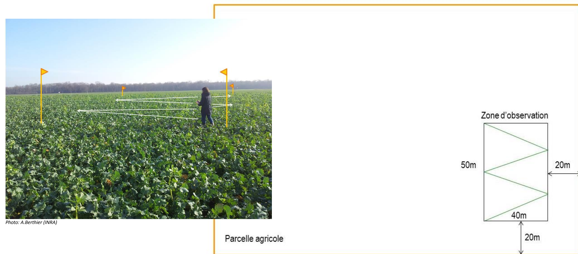
Figure 1 : dispositif du suivi simplifié des adventices sur une zone d'observation

Le suivi des adventices est réalisé sur une aire géoréférencée de 2000m 2 homogène (topographie, type de sol, pierrosité, ...) et représentative de la parcelle. La localisation de la zone d'observation est identique d'une année sur l'autre. L'observateur effectue un aller-retour en W dans la zone d'observation.